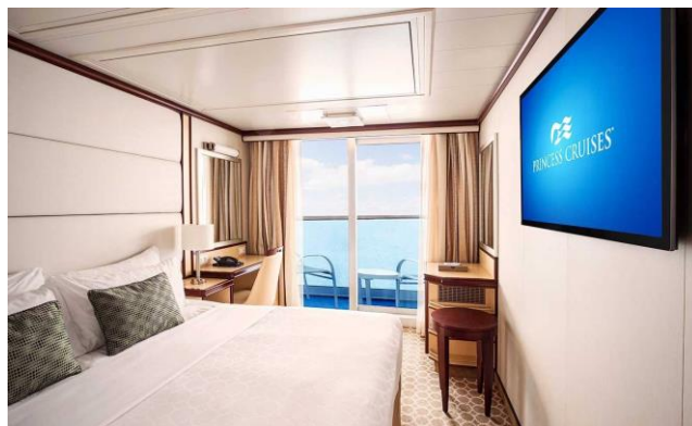
Cabina cu balcon